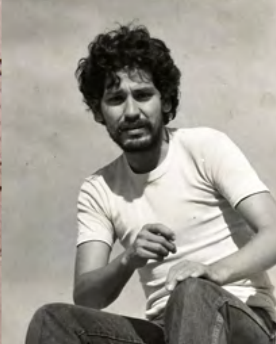
El joven cuestionador que también incursionaría en el mundo del video y la televisión.