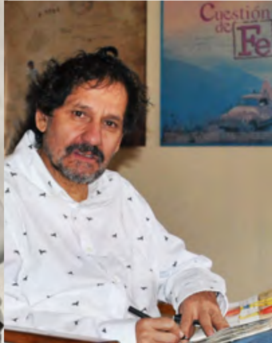
En su casa, dibujando.

“Trabajo intensamente y he dejado de hacer muchas cosas divertidas en la vida, para poder trabajar. Como cualquier empleado que tiene que estar a las ocho de la mañana en su oficina, yo dibujo, escribo y veo cine todos los días”.